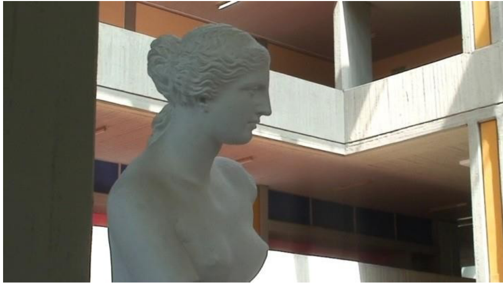
Museum of History and Archaeology, School of Philosophy, National and Kapodistrian University of Athens