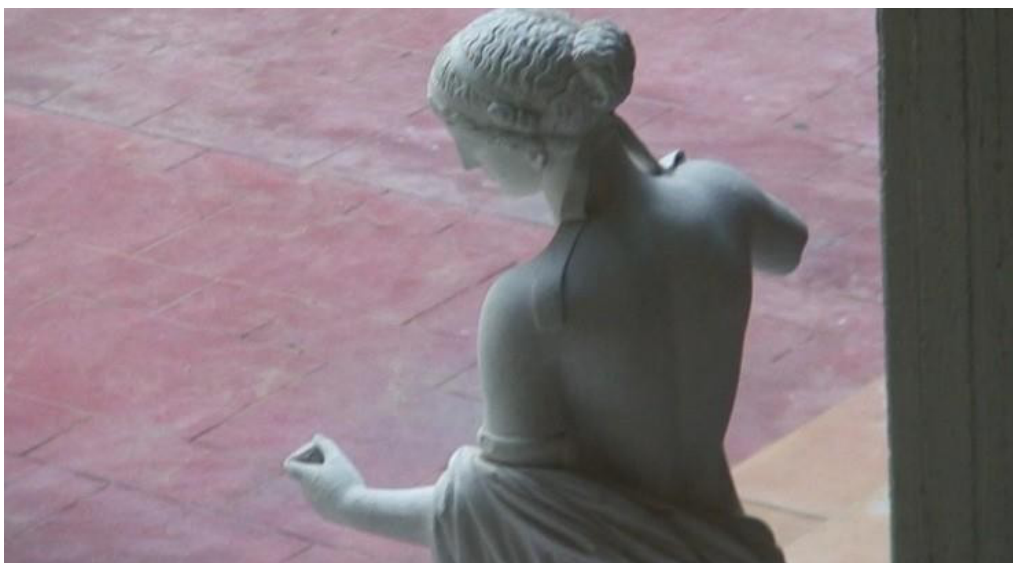
Museum of History and Archaeology, School of Philosophy, National and Kapodistrian University of Athens